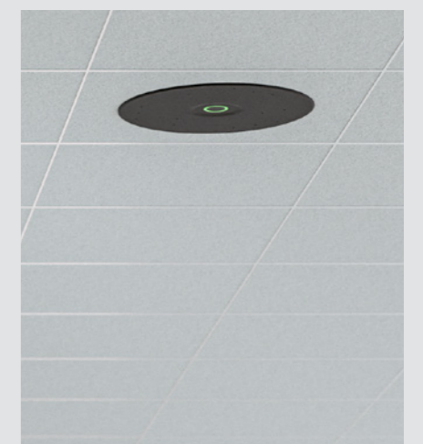
天井に埋め込み設置