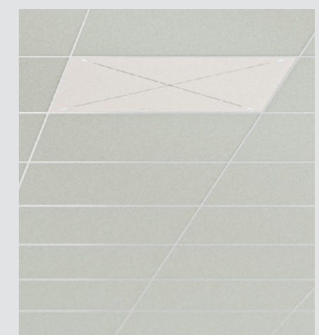
天井に埋め込み設置