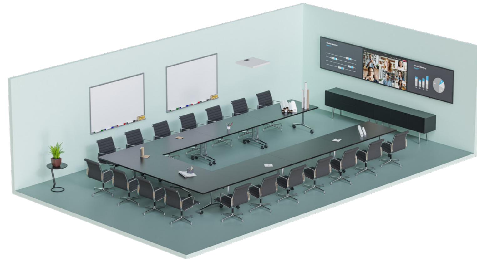
TeamConnect Ceiling 2 を装備した大規模な会議室。