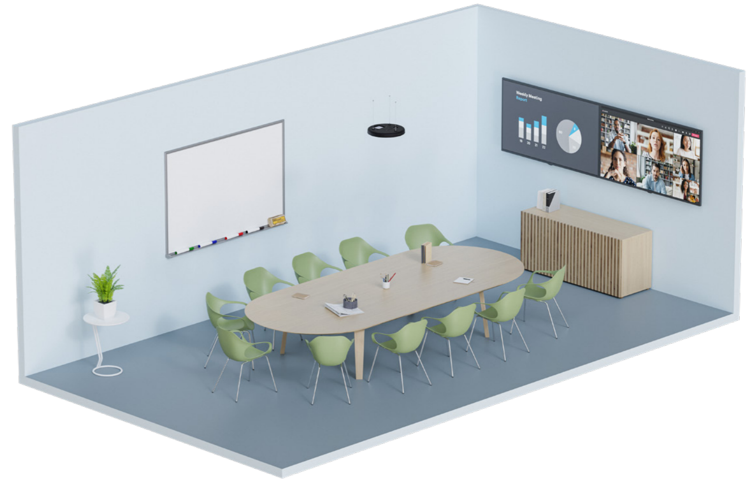
TeamConnect シーリングメディアを装備した中規模会議室。