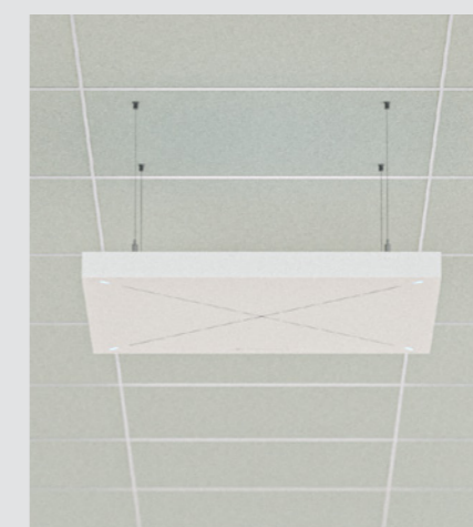
天井吊り下げ設置